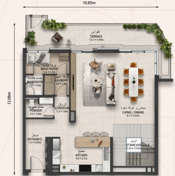
الطابق السفلي LOWER FLOOR

الإطلالة Views الميناء والجزيرة Port & Island