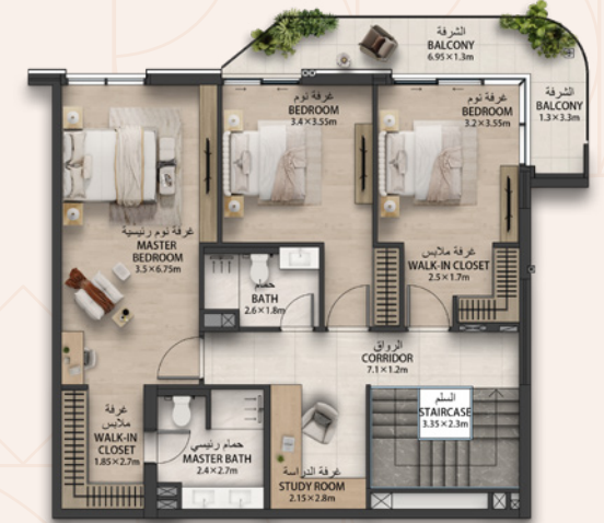
الطابق العلوي UPPER FLOOR